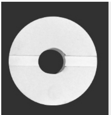
Base de cerâmica