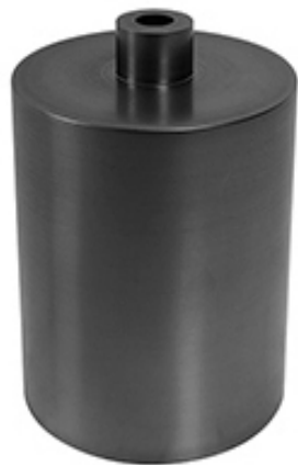
Cadinho de Grafite