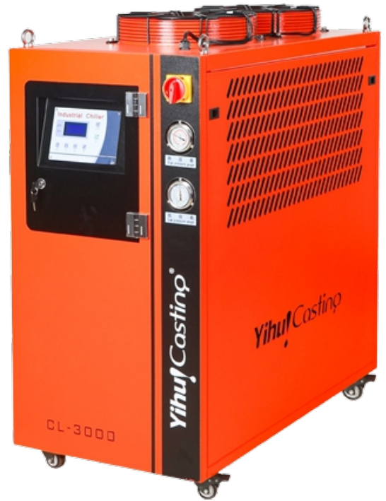
Resfriador de água