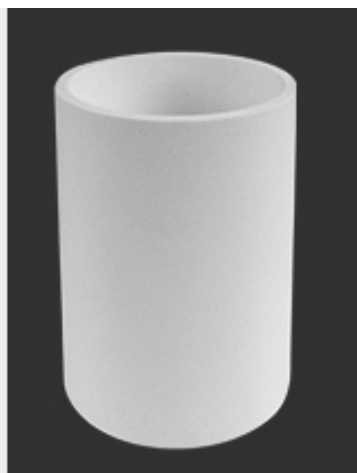
Cobertura de cerâmica