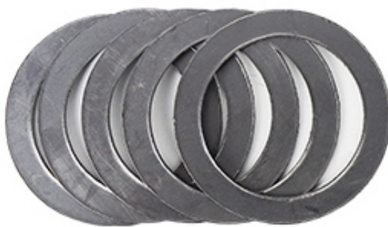
Discos de Grafite