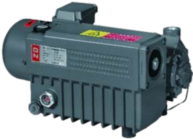
Bomba de Vácuo